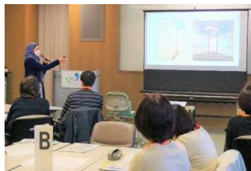
専門課程 多文化共生サポーター養成講座